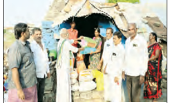
బాధితులకు నిత్యావసరాలు, దుస్తులు అందిస్తున్న దాతలు

ఈశ్వరయ్య తదితర దాతల దాతృత్వాన్ని ఆ కాలనీ వాసులు ప్రత్యేకంగా అభినందించారు. ఇంటి చుట్టూ దుర్భాగం మును రుకున్న వాతావరణంలో, చిన్న గుడిసెలో కటిక పేదరికాన్ని ఆనభవిస్తూ పక్క తరబడి ఆ కుటుంబం అందు వెళ్లడేమీ పాలకలకు, అధికారులకు కనీసం ఒకపాదం బాధాకరమని స్థానికులు ఆవేదన వ్యక్తం చేశారు. అన్ని అధికారులు నామ ఒక్క ప్రభుత్వానికి కనీసం వీరికి కొద్దిగా జాగ్రత్త, చిన్న ఇళ్ల నిర్మించి సాయపడాలనే ఆలోచన కలగ పోవడం విధ్వంసం.