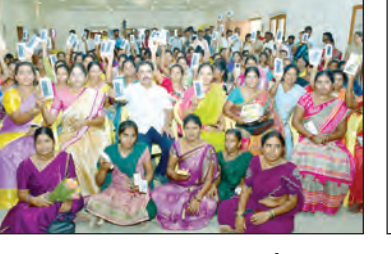
యానిమేటర్లకు స్టార్ట్ ఫోన్ల పంపిణీ చేస్తున్న ఎమ్మెల్యే అమిలినేని

కార్యాభివృద్ధి, మే 13, ప్రభాతవార్త: ప్రతి కుటుంబం నుంచి కనీసం ఒక మహిళ వ్యాపారవేత్తగా ఎదిగి కుటుంబానికి ఆర్థిక స్థిరత్వం తీసుకు రావాలని ఎమ్మెల్యే ఆమిలినేని సురేంద్ర బాబు విలుపునిచ్చారు. బుధ వారం ప్రజాచేదికలో సెన్సీవ్ టీడీ శైలజ అధ్యక్షతన నిర్వహించిన మహిళా సంఘాల యానిమేటర్లకు స్టార్ట్ ఫోన్ల పంపిణీ కార్యక్రమంలో ఆయన ముఖ్య అతిథిగా పాల్గొన్నారు. ఈ సందర్భంగా రాష్ట్ర ముఖ్యమంత్రి నారా చంద్రబాబు నాయుడు చిత్తపటానికి మహిళలతో కలిసి పాల్గొనేటం నిర్వహించారు. ఆనంతరం నియోజకవర్గంలోని 209 మంది గ్రామ సంఘాల (పీఠీ) యానిమేటర్లకు స్టార్ట్ ఫోన్ల పంపిణీ చేశారు.