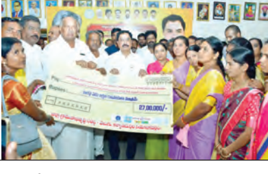
వడ్డీ లేని రుణాల చెక్కును అందజేస్తున్న దృశ్యం

ఈ సందర్భంగా ఎమ్మెల్యే మాట్లాడుతూ, గత ప్రభుత్వ హయాంలో మహిళా సంఘాలకు అందాల్సిన స్ట్రీట్ లైటింగ్ కు బాధ్యత వహించాలి. కేసీసీ దుర్వినియోగం అయ్యాయని విమర్శించారు. ప్రస్తుతం కూటమి ప్రభుత్వం మహిళా సాధికారతకు ప్రాధాన్యం ఇస్తూ, ప్రతి కుటుంబం నుంచి ఒక వ్యాపారవేత్తను తయారు చేయాలనే లక్ష్యంతో ముందుకు సాగుతుందని తెలిపారు. దేశంలో మహిళా సంఘాల ఏర్పాటు ద్వారా ఆర్థిక స్వావలంబనకు బాటలు వేసిన ఘనత చంద్రబాబు నాయుడు దేసిన కోని యాచారు. ప్రధానమంత్రి సరేంద్ర మోడీ కూడా ధీమాలు, ఆర్థిక క్రమశిక్షణ ప్రత్యేక దృష్టి పెట్టాలని సూచించారు. ఆయనకు సేవలు చేసిన అన్ని వర్గాలను తగ్గించి ధీమాలు పెంచాలి. కేసీసీలో మహిళలకు సూచించారు. కార్యాభివృద్ధి నియోజకవర్గంలో ఇప్పటివరకు మహిళా సంఘాలను సుమారు రూ.200 కోట్ల రుణాల అందించామని, వాటిని బీబీఎస్ క్లబ్ రూ.500 కోట్లకు పెంచే దిశగా చర్యలు తీసుకోవాలని అధికారులను